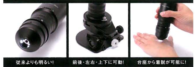
従来よりも明るい!

特殊スタンドを採用したことにより 身体のどの部位も観察することが可能になりました。