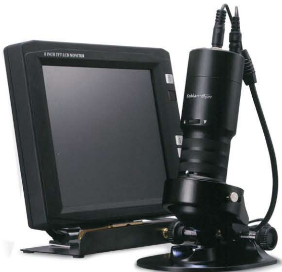
VIDEO MICRO SCOPE SC-10